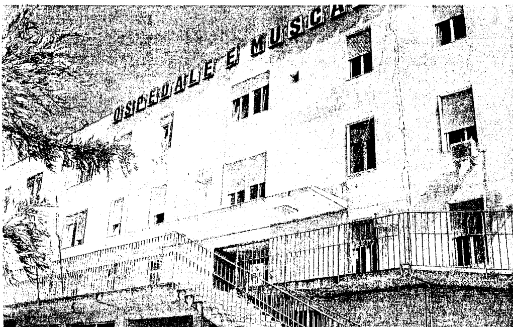
Al Muscatello il nuovo ed unico reparto di ostetricia degli ospedali di Augusta e Lentini