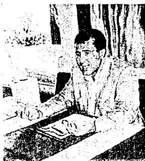
L'ON. MARIO BONOMO

Moderatamente soddisfatto e convinto che non va abbassata la guardia per definire al più presto la pianta organica. Il deputato regionale del Pd Mario Bonomo interviene sull'apertura dell'hospice sottolineando l'importanza di avere finalmente una struttura funzionante. «Specie se si pensa all'incredibile e paradossale situazione, che ho ripetutamente denunciato, di un "pezzo" così importante della sanità pubblica completata da tempo, dotata anche degli arredi, ma che restava chiusa (inaugurazioni a "orologeria" a parte) in un intolle-